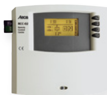
Steca RCC-02 Commande à distance et affichage (2 m de câble inclus) Convient au montage mural (voir page 39).