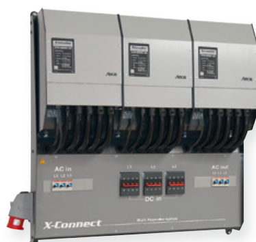
Steca X-Connect-System Structure de montage précâblé pour les appareils de la série Steca Xtender XTH.