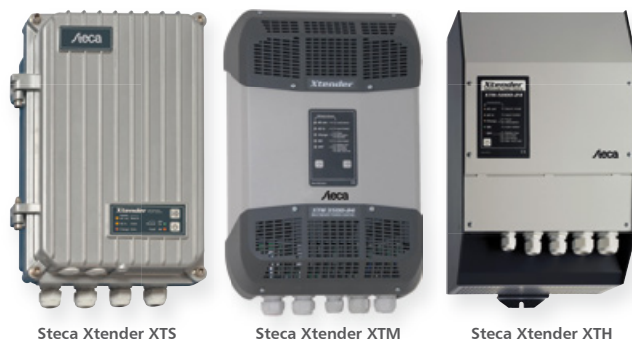
Steca Xtender XTS